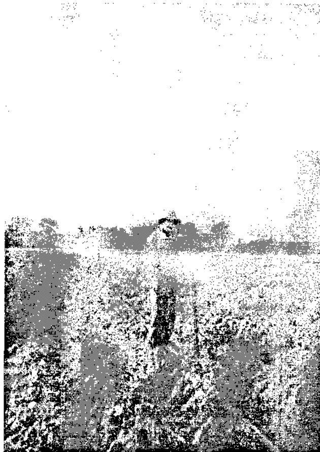
اندازه گیری فشار سرآبپاش‌ها توسط فشار سنج پیتو