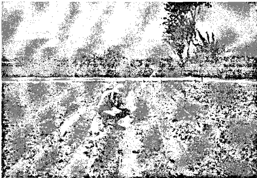
قرائت فلوم WSC جهت اطمینان از دبی ورودی (۱ لیتر در ثانیه) به شیارها