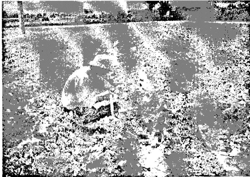
قرائت زمان پیشروی آب در شیار